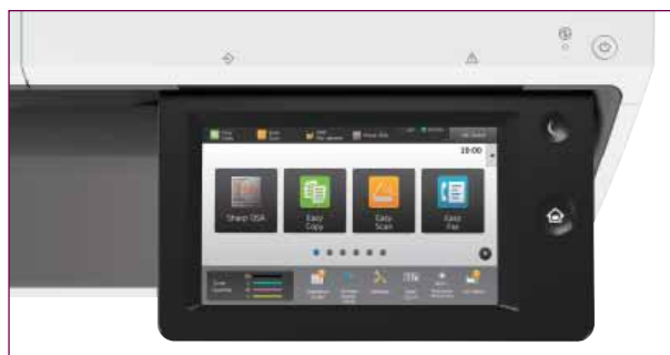
Gli utenti possono personalizzare la schermata home per lavorare in modo più efficiente.

Queste MFP sono dotate di un ampio touchscreen a colori da 7" che può essere orientato per consentire la massima visibilità. Easy Mode garantisce inoltre l'accesso immediato alle funzioni di uso quotidiano, come "Scansione" e "Copia", visualizzandole sotto forma di grandi icone. Oppure, se ci sono altre funzioni utilizzate con maggiore frequenza, puoi semplicemente trascinare le relative icone sulla tua schermata home per velocizzare l'accesso.