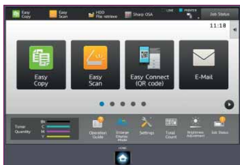
L'icona QR può essere facilmente configurata nella schermata Home.

Per una flessibilità ancora maggiore, la doppia connettività di rete opzionale permette di condividere la stessa MFP su due reti diverse, una delle quali può essere wireless, anche se hanno limitazioni di utilizzo o impostazioni di sicurezza diverse.