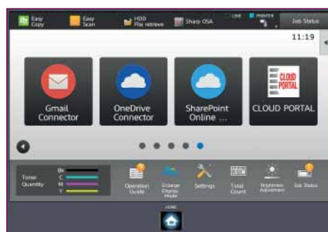
Connessione diretta a servizi di cloud pubblici e Cloud Portal Office.

Diminuisce anche il rischio di dimenticare documenti importanti o sensibili dove chiunque possa vederli. Grazie alla funzione Print Release puoi inviare un lavoro da stampare e, quando sei pronto, avvicinarti alla stampante più comoda, accedere e stampare le informazioni.