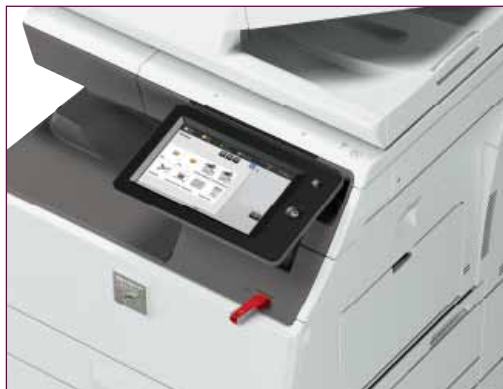
Inserisci la tua USB e inizia a stampare o ad acquisire.

Un'unità hard disk (HDD) integrata da 500 GB consente di archiviare documenti voluminosi e complessi, cui si può accedere rapidamente grazie al sistema di archiviazione documentale. Per la massima praticità, la tecnologia Office Direct Print di Sharp* ti permette di stampare qualsiasi documento senza dover nemmeno usare il PC. Ti basta avvicinarti alla MFP, inserire una chiavetta USB contenente immagini, file Adobe PDF o Microsoft® Office e stampare ciò che desideri. Oppure puoi acquisire e salvare rapidamente i documenti direttamente sulla USB.